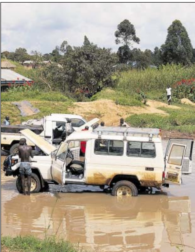
Autowaschen in Uganda: einfach den Geländewagen in den Nil fahren, sauber machen und wieder rausfahren. Ölabscheider? Fehlanzeige.