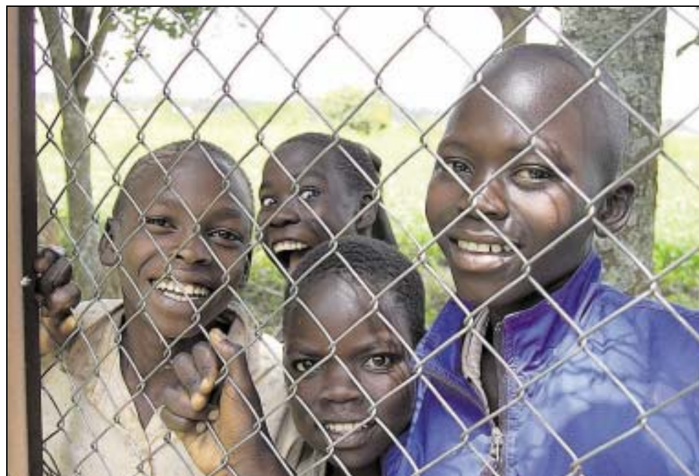
Auch wenn die Kinder nicht aufs Bäckereigelände durften, standen sie ständig am Zaun und freuten sich über jedes Foto, das von ihnen gemacht wurde.

Einwohner (Deutschland: 3,5 pro 1000 Einwohner) Zugang zu sauberem Trinkwasser: 56 Prozent (Deutschland 100 Prozent) Zugang zu Sanitäreinrichtungen: 41 Prozent (Deutschland: 100 Prozent) HIV-Infizierte: 600.000 (Deutschland: 56.000)