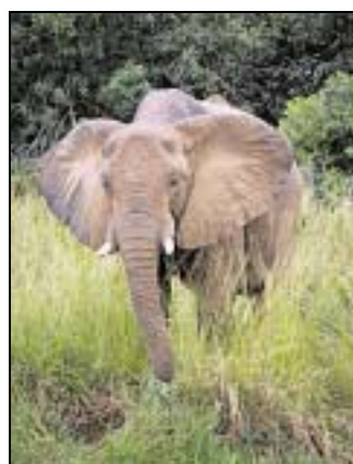
Hautnah erlebten die Balver die afrikanische Tierwelt,

Westermann. Das Leben pulsierende, die Geschäfte seien zum großen Teil verkommen mit Ausnahme der Telefonshops, die alle frisch renoviert und mit nagelneuer Fassade glänzen. „Die Telefonindustrie hat das Land im Griff“, sagt Jörg Westermann. In Uganda gibt es kein Festnetz, dafür ein hervorragendes Mobilfunknetz, so dass die Einwohner einen hohen Anteil ihres Geldes für das Telefonieren ausgeben. In den Shops gibt es Mobiltelefone, an denen die Gespräche nach Minuten abgerechnet werden.