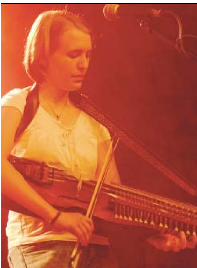
Die Band „As-Seirbhis“ benutzte auch ungewöhnliche Instrumente für ihre emotionalen Arrangements der Folk-Songs.

Ein paar Eintrittskarten für den heutigen Freitag und den morgigen Samstag gibt es noch im Vorverkauf unter festspiele-balver-höhle.de im Internet, oder ☎ 02375/1030 und an der Abendkasse. Kinder bis 14 Jahre haben in Begleitung eines Erwachsenen freien Eintritt.